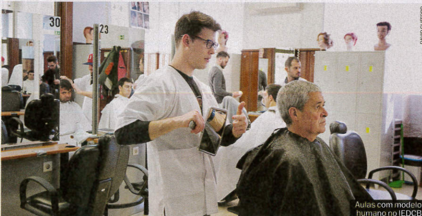
Aulas com modelo humano no IEDCB