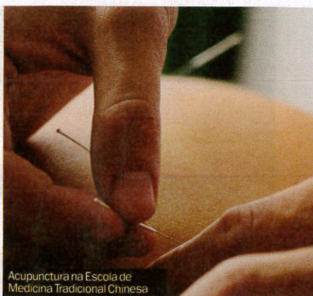
Acupuntura na Escola de Medicina Tradicional Chinesa