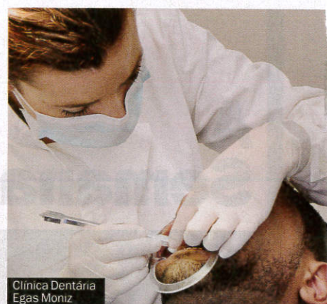
Clínica Dentária Egas Moniz